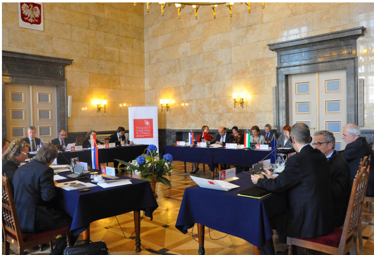
Spotkanie ministrów ds. rozwoju regionalnego państw Grupy Wyszehradzkiej i Słowenii, Katowice, 11-12 października 2012 r.

ności naszych gospodarek. Na koniec ministrowie przyjęli wspólną deklarację, podsumowującą dwudniowe spotkanie.