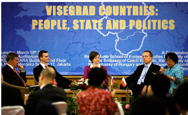
Inauguracja Kursu Wyszehradzkiego na Uniwersytecie Indonezyjskim w Dżakarcie, 19 marca 2013 r.

Pierwszy raz w realizację programu przewodnictwa w Grupie Wyszehradzkiej na dużą skalę zaangażowały się polskie ambasady. W różnych miejscach świata zorganizowano kilkadziesiąt przedsięwzięć promujących środkowoeuropejską współpracę regionalną. W Pekinie i Tokio ambasady zorganizowały seminaria eksperckie o szansach współpracy państw azjatyckich z naszym regionem. Dodatkowym tematem japońskiego seminarium była promocja idei Partnerstwa Wschodniego. Ambasada RP w Indonezji zaangażowała się w uruchomienie Kursu Wyszehradzkiego na prestiżowym Uniwersytecie Indonezyjskim w Dżakarcie. Szereg placówek zagranicznych, m.in. w Moskwie, Kijowie, Bernie, Madrycie, Rzymie i Rydze, zorganizowało seminaria i konferencje, Ambasada RP w Bukareszcie współorganizowała konferencję poświęconą tematyce bezpieczeństwa energetycznego w Europie Środkowej. To tylko kilka przykładów z długiej listy przedsięwzięć zrealizowanych przez polskie placówki.