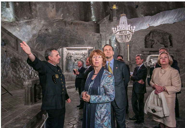
Spotkanie ministrów spraw zagranicznych państw V4, Partnerstwa Wschodniego, Irlandii i Litwy, z udziałem WP C. Ashton i kom. Š. Füle, Kraków/Wieliczka 17 maja 2013 r. Uczestnicy spotkania podczas zwiedzania Kopalni Soli „Wieliczka”.

pełnego otwarcia na państwa PW takich europejskich programów jak „Erasmus” czy „Kreatywna Europa”.