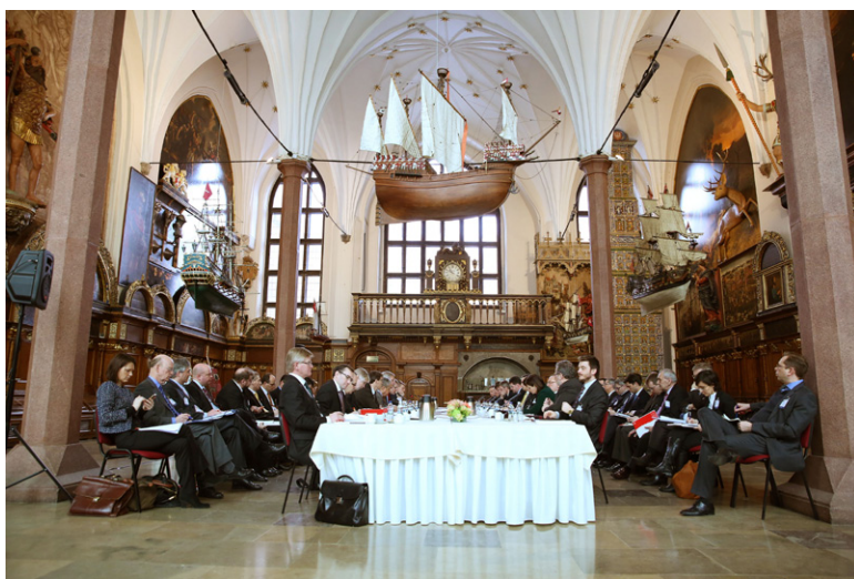
Spotkanie ministrów spraw zagranicznych państw V4, krajów nordyckich i bałtyckich, Gdańsk, 20 lutego 2013 r.

Obok tradycyjnych poniekąd obszarów i form współpracy wyszehradzkiej polska prezydencja przyniosła też nowe przedsięwzięcia. Należy do nich pierwsze spotkanie w szerokim gronie regionalnym Europy Środkowej i Północnej. Dyskusja ministrów spraw zagranicznych 12 krajów wyszehradzkich, nordyckich i bałtyckich w Gdańsku, poświęcona kwestiom ekonomicznym i politycznym, w tym obronnym z punktu widzenia regionalnego, wykazała, że tak zróżnicowane, wydawałoby się, państwa wiele kwestii postrzegają podobnie.