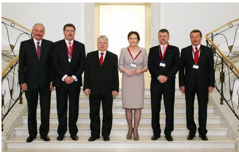
Spotkanie przewodniczących parlamentów państw Grupy Wyszehradzkiej, Warszawa, 12-13 kwietnia 2013 r.

od 1 lipca 2012 r. przez Rzeczpospolitą Polską przewodnictwa w Grupie Wyszehradzkiej. Senatorzy podkreślali znaczenie współpracy z państwami trzecimi w formule V4+ i zaapelowali do parlamentarzystów pozostałych państw wyszehradzkich, by wsparli wysiłki swoich rządów mające na celu dynamizację współpracy regionalnej. Pod koniec stycznia 2013 roku w Warszawie spotkali się parlamentarzyści V4 reprezentujący komisje administracji, samorządu lokalnego i rozwoju regionalnego. Spotkanie zakończyło się przyjęciem wspólnego oświadczenia, w którym podkreślano znaczenie funduszy spójności dla dalszego dynamicznego rozwoju naszego regionu.