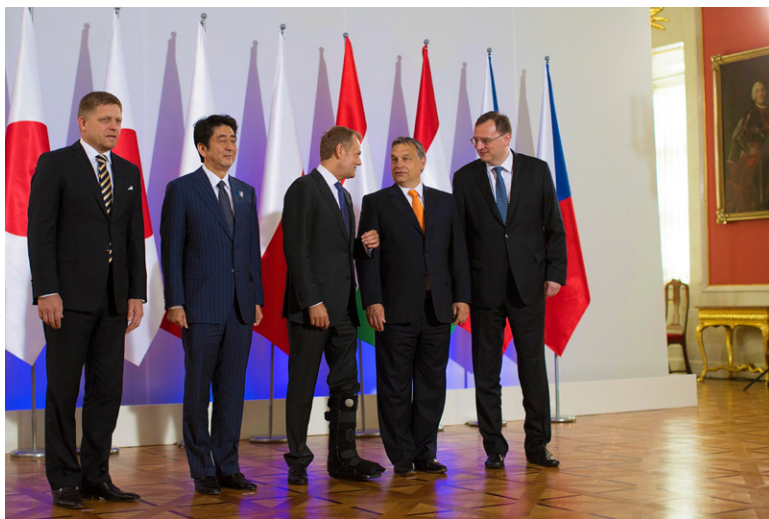
Szczyt premierów państw V4 z udziałem premiera Japonii Shinzō Abe, Warszawa, Zamek Królewski, 16 czerwca 2013 r.

Premierzy V4 spotkali się ponownie na zakończenie polskiego przewodnictwa w Grupie Wyszehradzkiej na Zamku Królewskim w Warszawie 16 czerwca 2013 roku. Szefowie rządów państw Grupy Wyszehradzkiej ogłosili „Mapę drogową w kierunku wspólnego regionalnego rynku gazu V4”, określając plan i założenia utworzenia regionalnego rynku gazu do 2018 roku. Jest to kolejny ważny etap realizacji jednego z priorytetowych dla naszego regionu projektów – stworzenia regionalnego rynku gazu, który państwa V4 konsekwentnie realizują także na forum UE. Na warszawski szczyt zaproszono premiera Japonii Shinzō Abe dla zaakcentowania dziesięcioletniej współpracy V4+Japonia. Dyskutowano o potencjale współpracy gospodarczej i naukowej między V4 a Japonią oraz realizacji wspólnych projektów na rzecz Partnerstwa Wschodniego. Przyjęto wyszehradzko-japońskie wspólne oświadczenie o „Partnerstwie opartym na wspólnych wartościach w XXI wieku”. Zdecydowano, że rok 2014 będzie specjalnym Rokiem Wymiany V4+Japonia. Czerwcowe spotkanie było też okazją do przedstawienia priorytetów i programu węgierskiej prezydencji w Grupie Wyszehradzkiej, która zaczęła się 1 lipca 2013 roku.