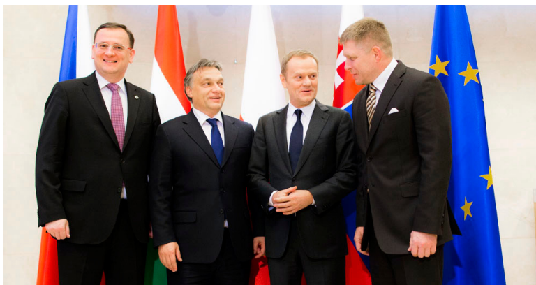
Spotkanie premierów państw Grupy Wyszehradzkiej przed posiedzeniem Rady Europejskiej, Bruksela, 13 grudnia 2012 r.

Przebieg polskiego przewodnictwa w Grupie Wyszehradzkiej wykazał, że V4, w warunkach natężonych wyzwań i trudnych dyskusji w Europie o dalszym rozwoju procesu integracji, stanowi konstruktywną siłę, umacniającą jedność naszego kontynentu. Najlepszym tego przykładem był sukces wspólnych działań w trakcie negocjacji nad Wieloletnimi Ramami Finansowymi UE na lata 2014-2020. Aktywność krajów Grupy Wyszehradzkiej w gronie Przyjaciół Spójności pozwoliła na przekonanie również płatników netto budżetu europejskiego, że na polityce spójności w UE nie wolno oszczędzać, bo jest to najlepszy motor wzrostu gospodarczego na kontynencie. Uniknęliśmy przy tym błędów z czasów naszych negocjacji akcesyjnych przed 2004 rokiem, kiedy negocjowaliśmy indywidualnie, co zaowocowało zróżnicowanym potraktowaniem naszych państw i wzajemnymi animozjami. Z obecnych negocjacji wyszliśmy silniejsi i ta siła została przez wiele ośrodków politycznych dostrzeżona.