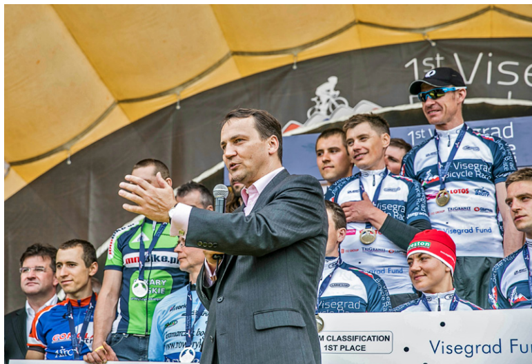
Ceremonia dekoracji zwycięzców I Wyszehradzkiego Rajdu Rowerowego, Kraków, 18 maja 2013 r.

Wyścig dzień wcześniej wystartował z Budapesztu, kolarze przejechali przez wszystkie cztery państwa wyszehradzkie. Przy tej okazji polskie placówki dyplomatyczne w Bratysławie, Budapeszcie i Pradze zorganizowały festyny i imprezy popularyzujące kolarstwo oraz ideę współpracy wyszehradzkiej.