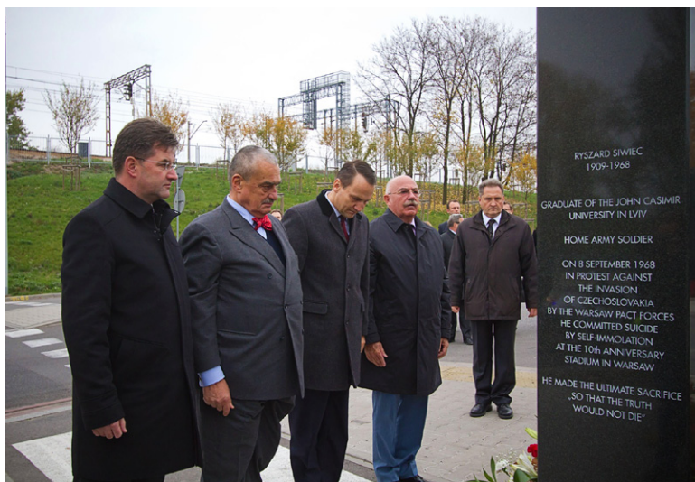
Spotkanie ministrów spraw zagranicznych V4 i Bałkanów Zachodnich, Warszawa, Stadion Narodowy, 25 października 2012 r. Przed spotkaniem ministrowie V4 złożyli kwiaty pod pomnikiem Ryszarda Siwca, który w dn. 8 września 1968 r. w czasie Centralnych Dożynek na Stadionie X-lecia dokonał samospalenia w proteście przeciwko interwencji wojsk Układu Warszawskiego w Czechosłowacji (20-21 sierpnia 1968 r.).

tych dwóch regionów wskazać należy politykę obronną, wzrost gospodarczy, rozwój infrastruktury energetyczno-transportowej, relacje ze wschodnimi sąsiadami czy rozszerzenie UE.